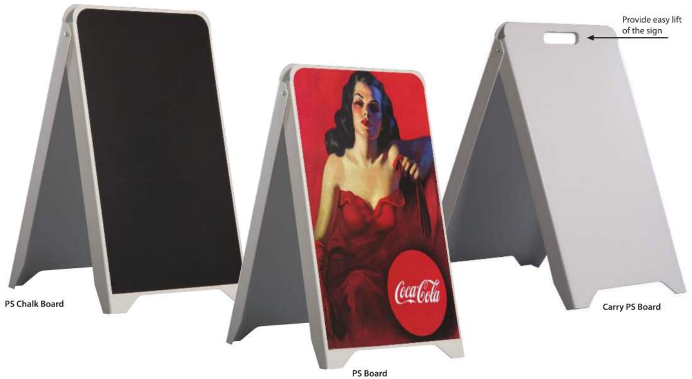
PS Chalk Board