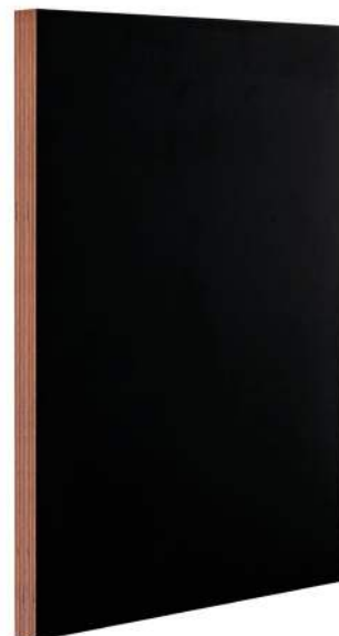
Frameless Wooden Frame