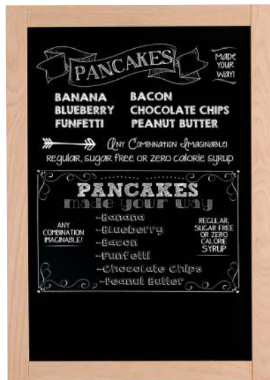
Easy Wood Frame

Windows, board and all non-porous surfaces.