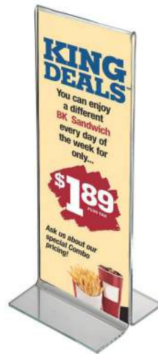
1/3 A4 Portrait